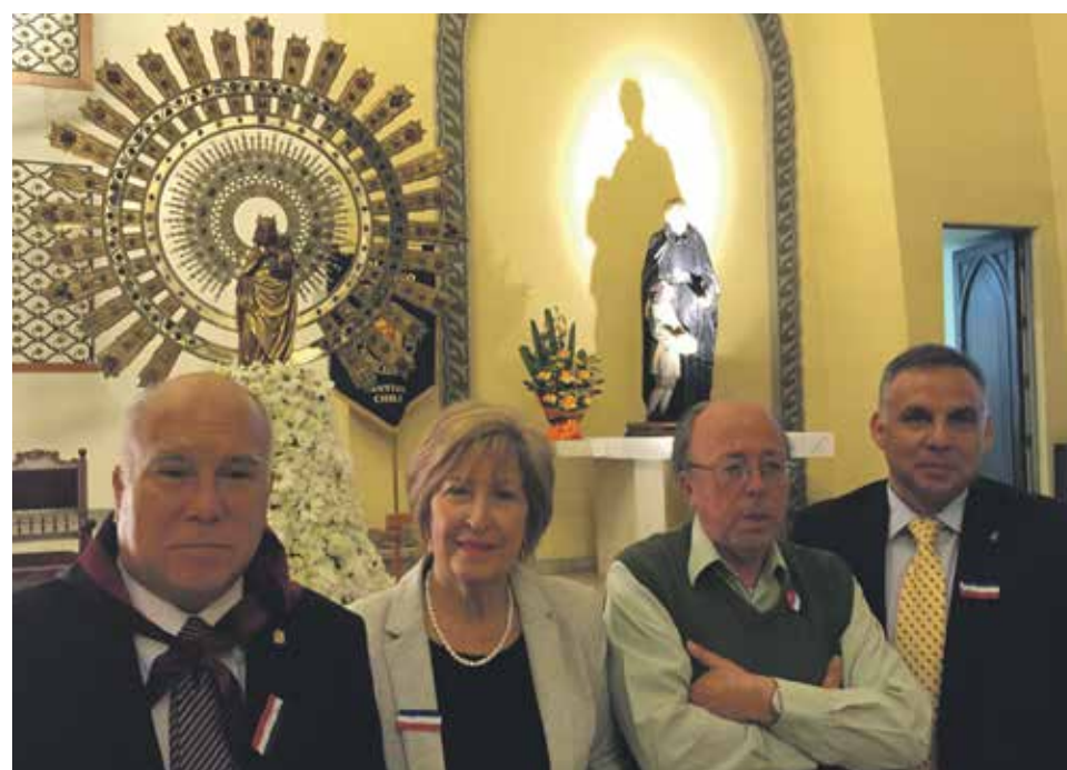
La Iglesia dedicada a la Virgen del Pilar en Santiago de Chile cumple 100 años.

El colegio fue creciendo (hoy tiene 1.100 alumnos) y la capilla se fue haciendo pequeña. Así, en 1948 se comenzó la actual construcción, inaugurada en 1953 tras cinco años de intenso trabajo. El título es oficioso, puesto que el fervor de los primeros religiosos puso el nombre de "Basílica" al templo, como en el caso del original de Zaragoza.