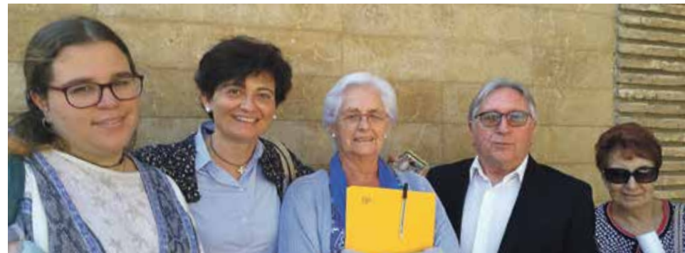
La delegación de misiones en la XXVIII Jornada de Animación Misionera.

El próximo 22 de octubre la Iglesia celebra la Jornada Mundial de las Misiones, el Domund, una jornada misionera en la que de un modo especial, la Iglesia universal reza por la misión y los misioneros y colabora con ellos. El lema del Domund de este año: "Sé valiente, la misión te espera" invita a ser valientes y comprometerse a fondo con la labor misionera de la Iglesia.