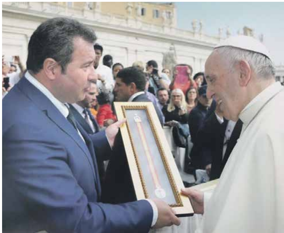
Ignacio Giménez entrega la medida de la Virgen al papa Francisco.

El viaje a Roma es con motivo del 400 aniversario de la Procesión del Santo Entierro de Cristo por las calles de Zaragoza.