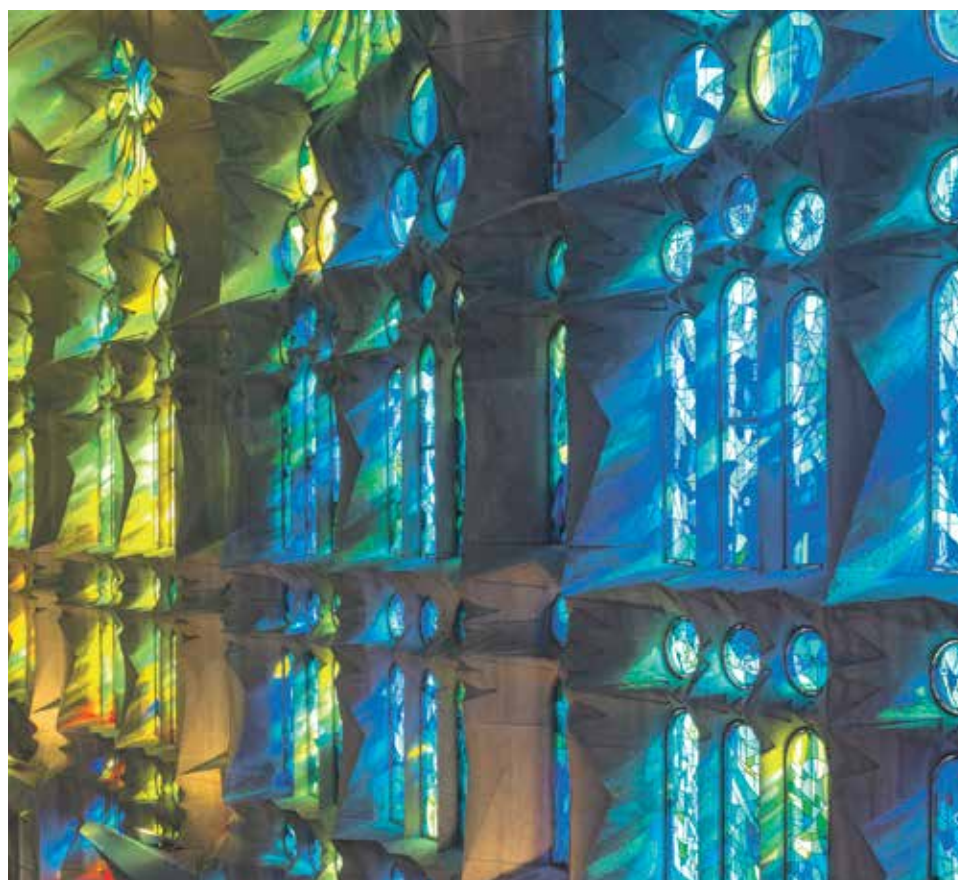
La Sagrada Familia de Barcelona atrae cada año a más de cuatro millones de turistas.

La muestra incorpora varias piezas audiovisuales y se cierra con una maqueta del templo finalizado, que permite conocer cómo será la Sagrada Familia una vez hecho realidad el sueño de Gaudí. De esta forma, Alma Mater Museum suma un hito más desde que en junio de 2016 se presentara a la sociedad con esa nueva marca.