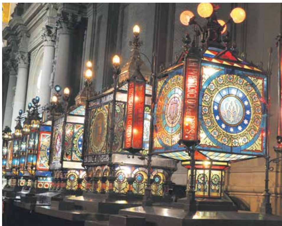
Faroles del Rosario del Cristal expuestos en la plaza del Pilar.

A partir de entonces, las celebraciones en honor de la Virgen se extienden por toda la ciudad, como es el caso de la iglesia parroquial de San Pablo que lidera la apertura del programa religioso del 12 de octubre, día festivo desde el año 1613, con ese Rosario de la Aurora que comienza a las cinco de la mañana y que ya recorría las calles camino de la basílica pilarista en el siglo XVIII. Cumplida la visita a la Virgen, retorna cantando a la insigne parroquia donde se celebra una misa aragonesa habitualmente interpretada por miembros de la Cofradía del Silencio.