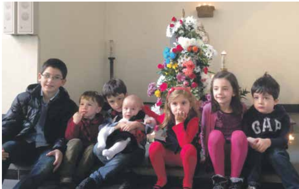
Niños aragoneses celebran la Virgen del Pilar en Londres.

“Desde la lejanía te das cuenta del privilegio que supone tener a la Virgen del Pilar como patrona” (Londres)