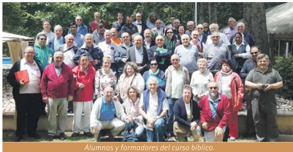
Alumnos y formadores del curso bíblico.

Cada uno de los días se trabajaron los temas: 1. El proyecto de Lucas: Evangelio y Hechos; 2. Jerusalén: la idealización de los orígenes. 3. Antioquía: los conflictos de abrirse al mundo. 4. Éfeso: el desafío oculto al Imperio. 5. Roma: la apertura al futuro.