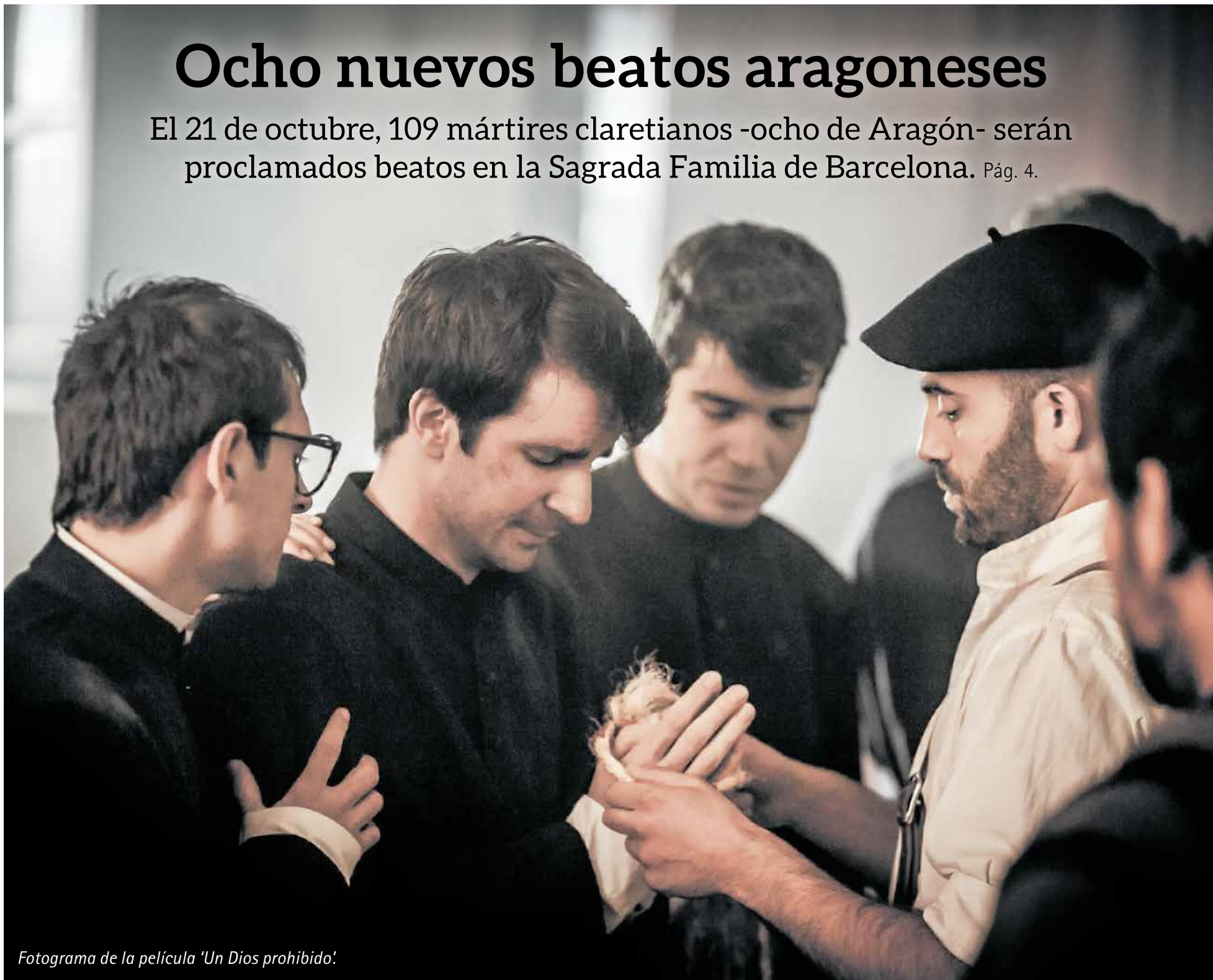
Fotograma de la película 'Un Dios prohibido'.

El 21 de octubre, 109 mártires claretianos -ocho de Aragón- serán proclamados beatos en la Sagrada Familia de Barcelona. Pág. 4.