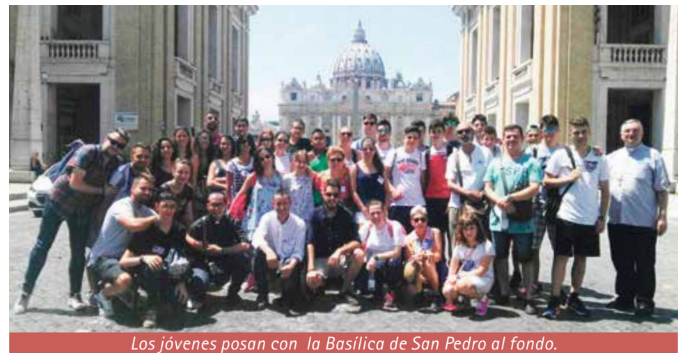
Los jóvenes posan con la Basílica de San Pedro al fondo.

Unos 40 jóvenes de la diócesis, acompañados por nuestro obispo, Antonio Gómez Cantero, han estado de peregrinación en Roma desde el 22 al 27 de julio.