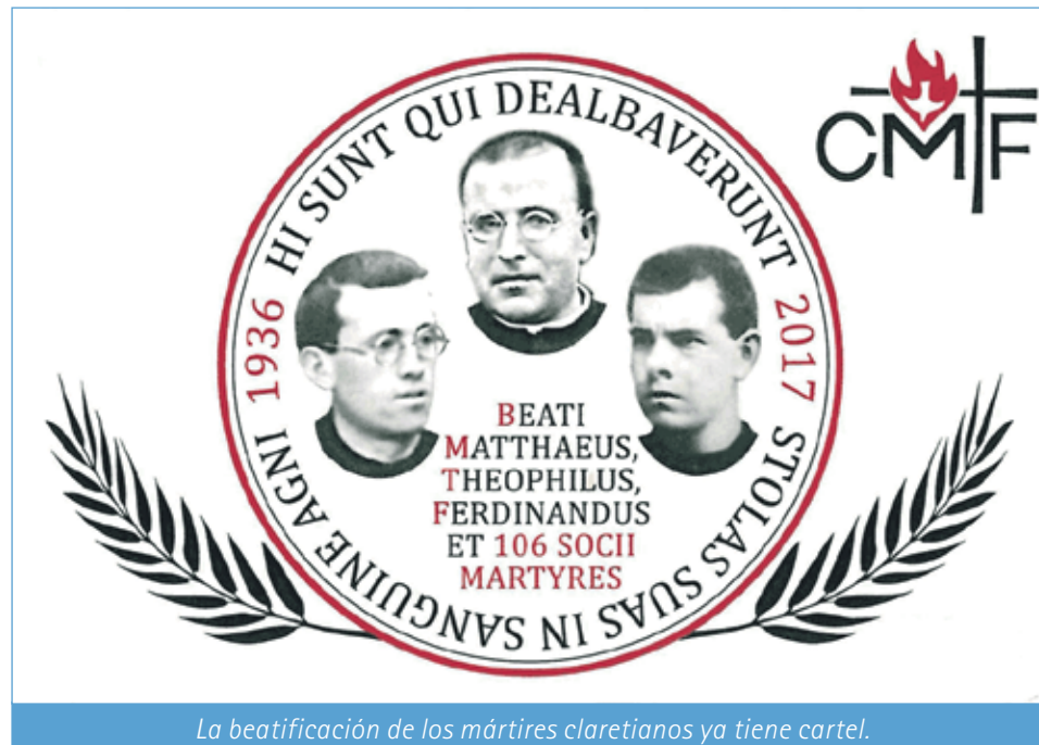
La beatificación de los mártires claretianos ya tiene cartel.

Como asegura Ayala, "estos dos martirios venían siendo objeto de permanente reflexión por parte de los jóvenes seminaristas claretianos que se preparaban para el sacerdocio durante la década de los años 20 y 30".