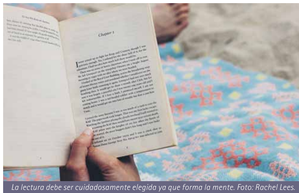
La lectura debe ser cuidadosamente elegida ya que forma la mente.