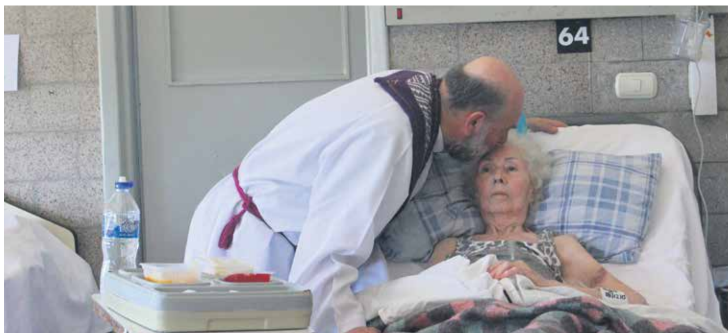
La Iglesia construye una sociedad mejor con su servicio cotidiano, en especial, a los más necesitados.

El folleto “NUESTRA IGLESIA”, editado en cada diócesis con una versión