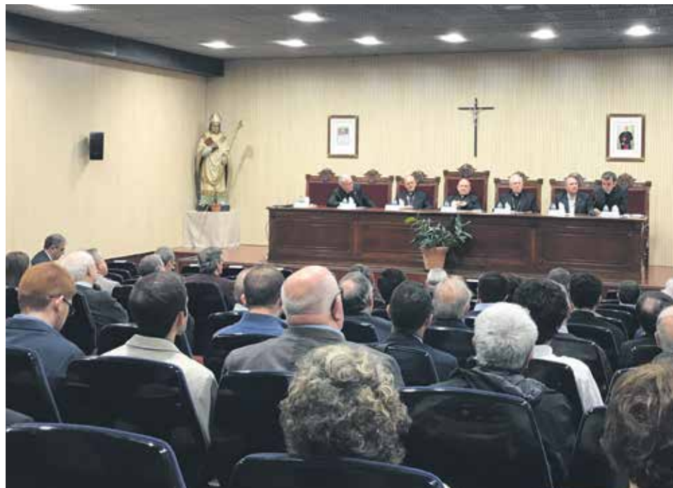
Los obispos aragoneses encabezaron el solemne acto académico.