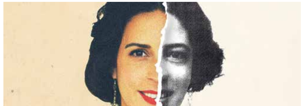
Cartel de la obra de teatro sobre Victoria Díez.

La Institución Teresiana y el Colegio Victoria Díez está celebrando, con el lema "El camino es nuestro", sus 100 años de presencia en Teruel, por ello han preparado una serie de actos para celebrarlo.