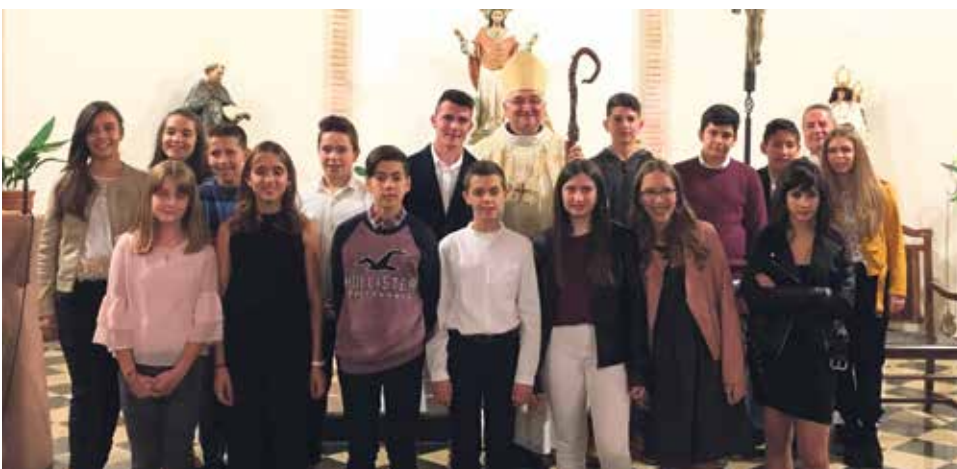
Confirmaciones de jóvenes de Villaspesa, Villastar y Villel.