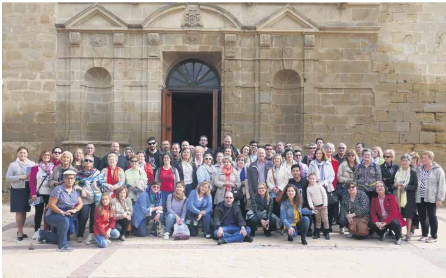
Encuentro Regional de Catequistas del año pasado.

Igualmente la Exhortación nos delinea unos peligros que corremos a la hora de vivir el camino espiritual y de los cuales nadie está libre. El Papa también nos marca una serie de características de la santidad del