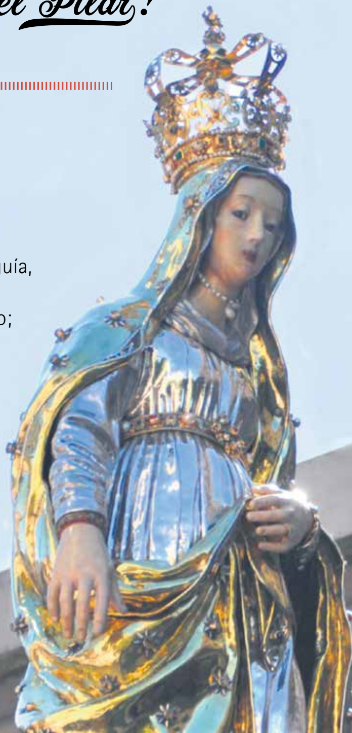
Imagen procesional en plata de la Virgen del Pilar, obra de Miguel Cubells (s. XVII).