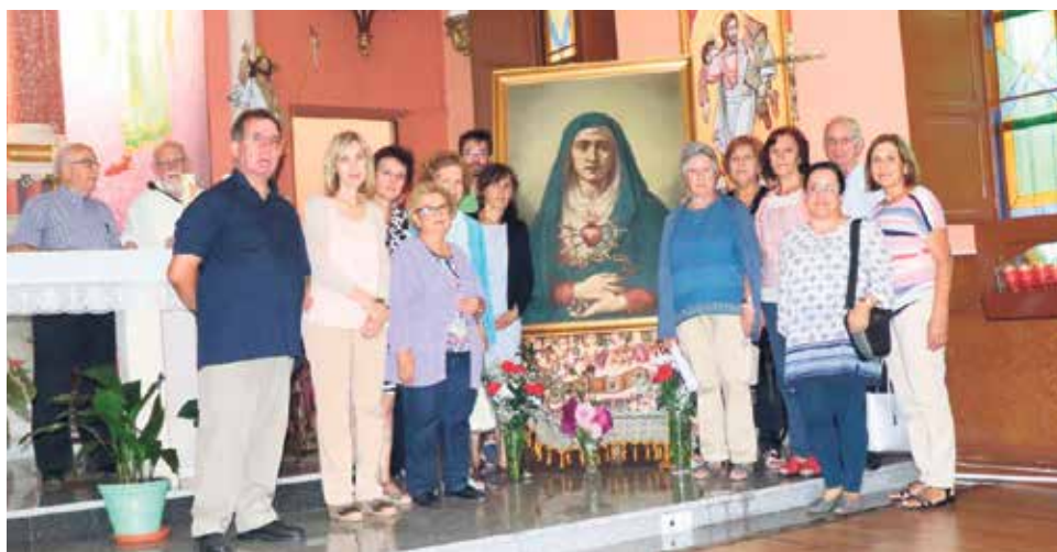
Los Cooperadores Amigonianos de Teruel posan junto a la Dolorosa.

El lunes 17 de septiembre, la Comunidad de Religiosos Terciarios junto al grupo de Teruel de Cooperadores Amigonianos, y los feligreses habituales del Santuario de San Nicolás, celebraron conjuntamente el día de la Virgen de los Dolores (15 de septiembre) y de los Mártires Amigonianos (18 de septiembre).