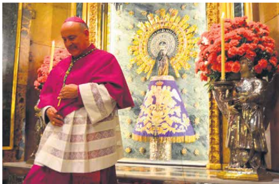
La Virgen del Pilar, punto de partida hacia Dios.

Esta herencia de fe mariana de tantas generaciones —decía el papa san Juan Pablo II en su estancia en Zaragoza, el 6 de noviembre de 1982— ha de convertirse no sólo en recuerdo, sino en punto de partida hacia Dios. Las oraciones y sacrificios ofrecidos, el latir vital de un pueblo, que expresa ante María sus seculares gozos, tristezas y esperanzas, son piedras nuevas que elevan la dimensión sagrada de una fe mariana".