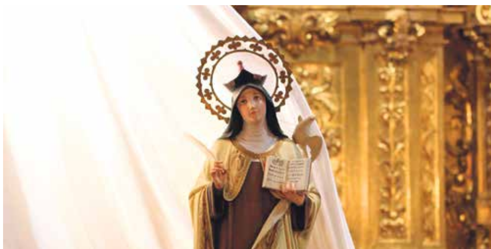
Imagen de Santa Teresa en el Convento de las Carmelitas de Teruel.

En honor de Santa Teresa de Jesús, en la Iglesia de las Carmelitas de Teruel, los días 14, 15, 16, y 17 de octubre se celebrarán los siguientes cultos: Misa Conventual, a las ocho y media de la mañana seguida de Exposición del Santísimo Sacramento. Ya por la tarde, a las seis y media, Sto. Rosario y oración a Sta. Teresa. Seguidamente Eucaristía presidida cada día por un Párroco de la