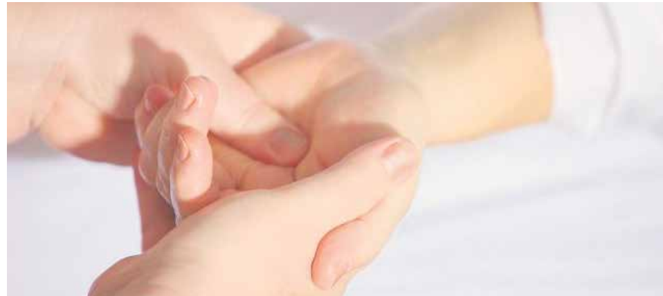
La medicina paliativa que reviste también una gran importancia en ámbito cultural.