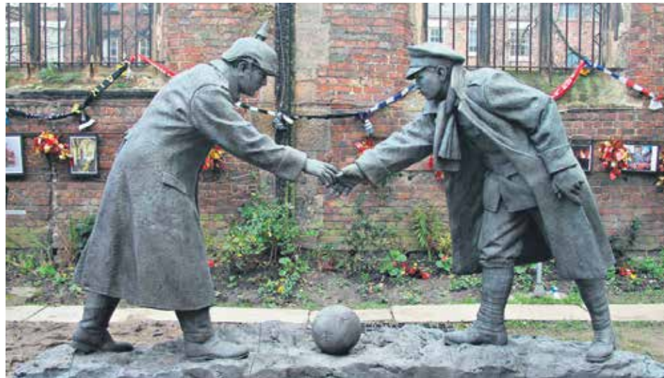
Escultura que representa la Tregua de Navidad, en la que un soldado alemán y otro británico estrechan sus manos para jugar al fútbol. Exterior de la iglesia de San Lucas, en Liverpool.

Nacido el 24 de octubre de 1873 en Theuley-les-Lavoncourt, al noreste de Francia, Jules Rimet vio la luz en una familia de profunda fe católica, una fe que se mantuvo cuando por razones económicas el clan tuvo que emigrar a París años después. Allí, en la capital francesa, el joven Jules entró en el Círculo de Obreros Católicos, donde se consolidó su creencia en la unión de todos los estratos sociales alrededor de un interés común. Gran aficionado al fútbol, empezó a considerar el deporte como un vehículo imprescindible para vencer las