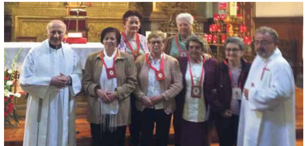
Miembros del APOR en el encuentro regional de Huesca.

Junio es el mes grande de nuestra Asociación del Apostolado de la Oración (APOR) o, como se llama ahora, de la RED MUNDIAL DE ORACIÓN DEL PAPA (RMOP). Junio nos invita a que hagamos verdad nuestro seguimiento a Aquel que "tanto amó que entregó su vida por nosotros". Mes de cercanías, mes de Amor, mes de trabajo por la felicidad de todos y de cada uno.