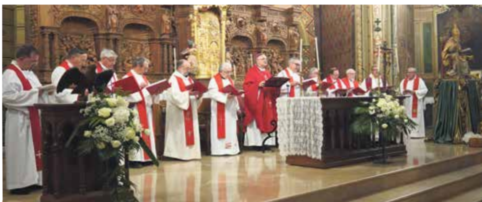
Fiesta de San Pedro y San Pablo en la Parroquia de San Pedro de Teruel.