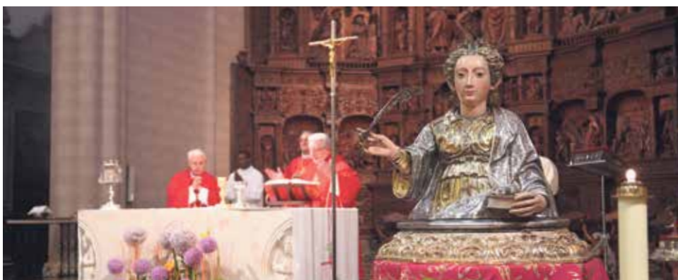
EL busto de Santa Emerenciana presidiendo la Eucaristía en la Catedral.

El primer domingo de las Fiestas del Ángel de Teruel está dedicado a la patrona de la ciudad, Santa Emerenciana, el mismo día en el que tiene lugar la constitución del Seisado, uno de los principales actos de las fiestas y en el que participan cinco matrimonios así como un concejal que hayan contraído matrimonio en el último año.